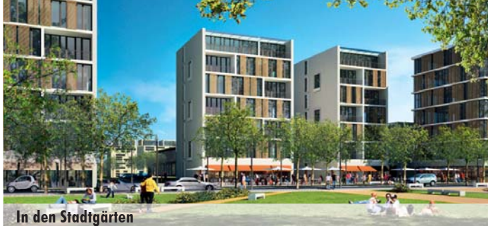
In den Stadtgärten